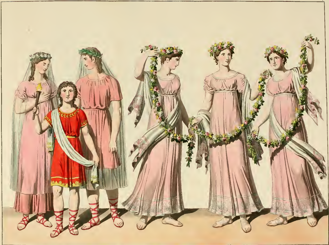
Psyche, Hymen, Eros